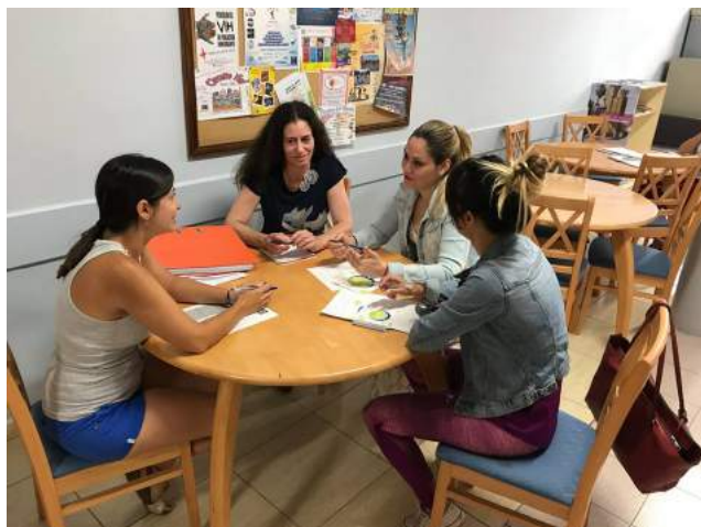
Encuentro con la Asociación Mojo de Caña

Personal de la Fundación General de la ULL se reúne con representantes de esta asociación para profundizar en las iniciativas que se están desarrollando.