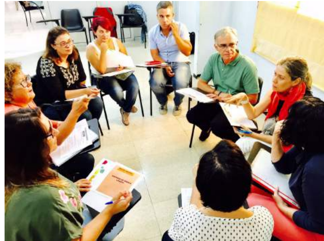
Red de agentes sociales del distrito suroeste de Santa Cruz

La sede de la Fundación Proyecto Don Bosco en Taco acogió una reunión entre representantes de las entidades de 'Barrios por el Empleo: Juntos más Fuertes'.