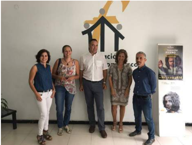
Encuentro de representantes de las entidades del proyecto

La sede de la Fundación Proyecto Don Bosco en Taco acogió una reunión entre representantes de las entidades de 'Barrios por el Empleo: Juntos más Fuertes'.