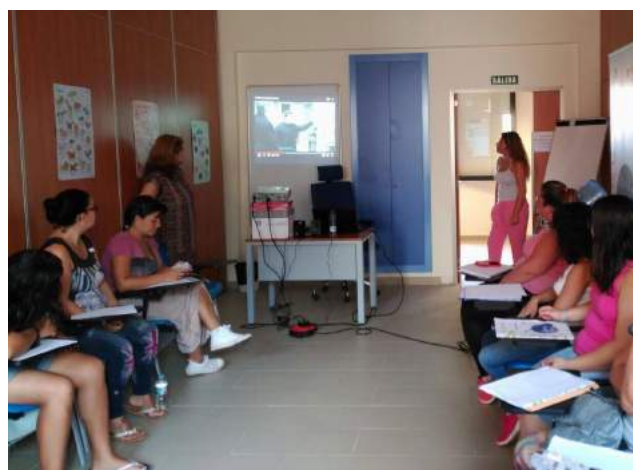
Igualdad de oportunidades entre hombres y mujeres

Reunión informativa con la Asociación de Vecinos de Chamberí, con el objetivo de presentar el proyecto a personas interesadas en participar en el mismo.