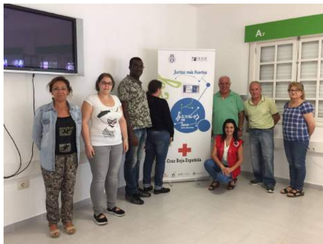
Curso de inserción laboral para personas con discapacidad

Personal de la Fundación General de la ULL se reúne con representantes de esta asociación para profundizar en las iniciativas que se están desarrollando.