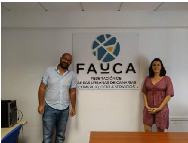
Colaboración de 'Barrios por el Empleo: J+F' con Fauca

Nueva reunión para intercambiar experiencias y, sobre todo, profundizar en las soluciones a los problemas que se plantean en la zona.