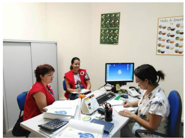
Presentación del proyecto en Guía de Isora

El equipo de prospección del área metropolitana continúa generando sinergias con la Federación de Áreas Urbanas de Canarias (Fauca).