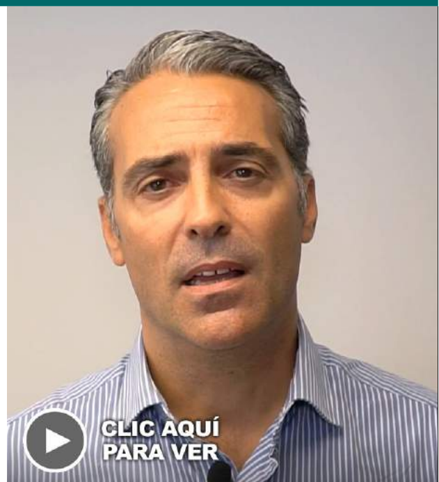
Granier Plaza Weyler, en Santa Cruz

Me gustaría destacar la cercanía, desde el proyecto me animaron a realizar una charla a un grupo de formación, pude explicarles de primera mano mi visión de las empresas y conocer la perspectiva de las personas desempleadas. Esa es